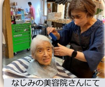
なじみの美容院さんにて

けれど分からないことは先輩たちに気軽に聞け、丁寧に明確に教えてもらえます。利用者さんは、ふれあうことで僕の顔を覚えてくれました。次に名前を。「あんたがおるけ、ここに来るよ」とも言って下さり、とても嬉しかったです。その様な中で、自然と介護や仕事に慣れていくことができたと思います。