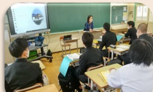
中学校の総合学習で職業講和