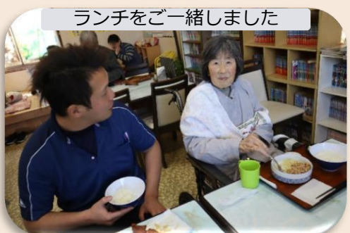
ランチをご一緒しました