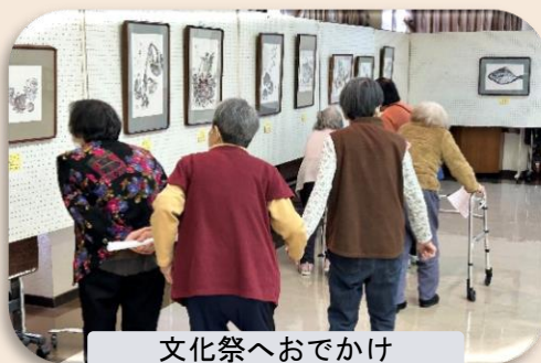
文化祭へおでかけ